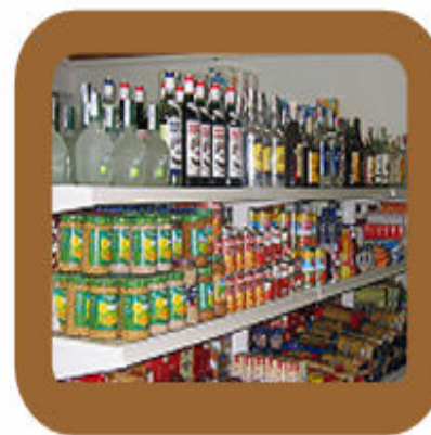
Edwin Escalante Ramos